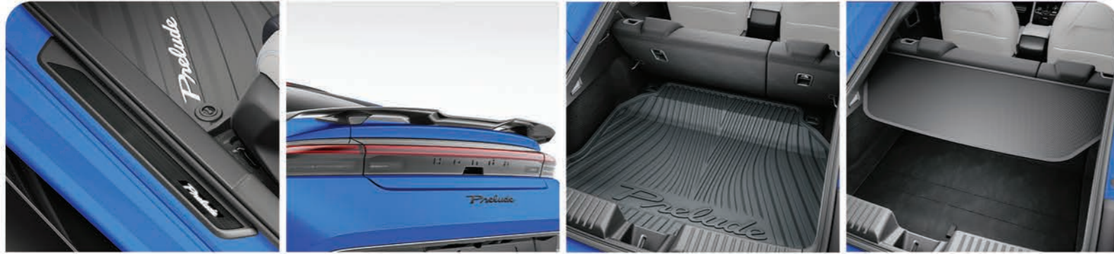
Adorno para piso de puertas con luz