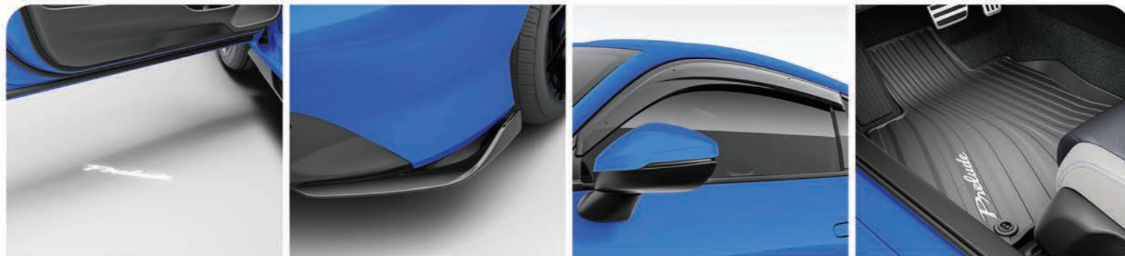
Proyector logotipo Prelude