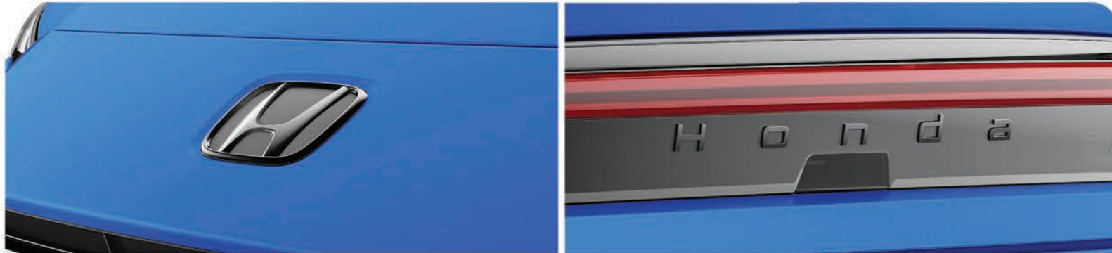
Emblemas negros, marca H delantera y trasera Honda