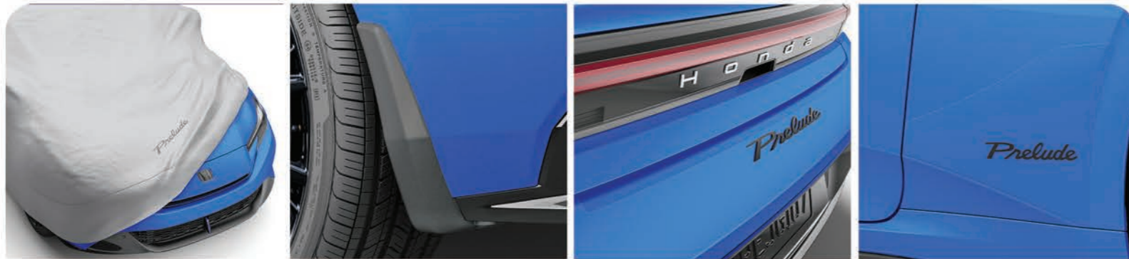
Funda de coche