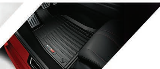
Tapetes toda temporada con logo Type S