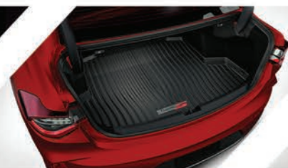
Bandeja de carga con logo Type S