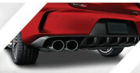
Difusor de fibra de carbono