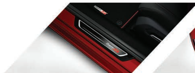
Adorno para piso de puerta iluminado con logo Type S