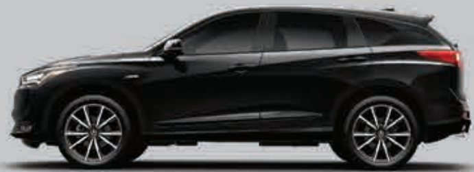
Exterior: Negro Supremo Interior: Café / Rojo