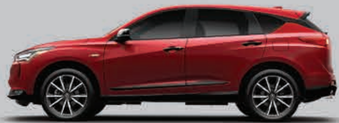
Exterior: Rojo Audaz Interior: Negro