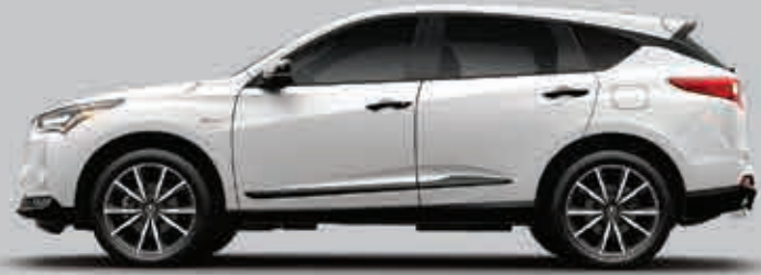
Exterior: Blanco Platino Interior: Negro / Café