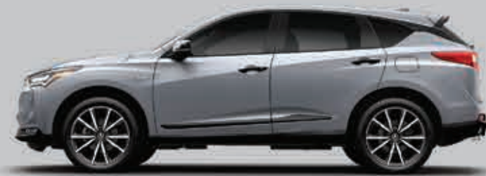
Exterior: Plata Solar Interior: Negro