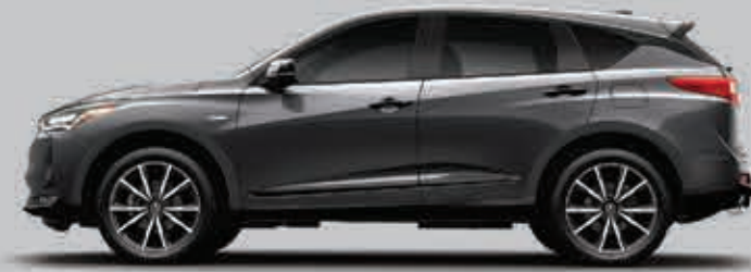
Exterior: Grafito Interior: Negro