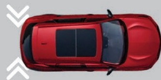
— SISTEMA DE PREVENCIÓN DE COLISIÓN TRASERA (CTM)