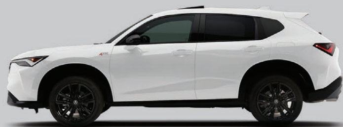
Exterior: Blanco Platino Interior: Negro / Rojo