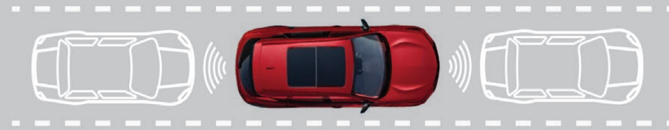
— SISTEMA DE ASISTENCIA EN TRÁFICO PESADO (TJA)