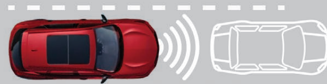
— CONTROL DE VELOCIDAD CRUCERO ADAPTATIVO (ACC) CON LIMITADOR DE VELOCIDAD PERSONALIZABLE