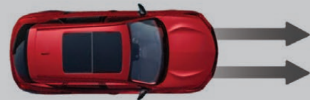
— SISTEMA DE MITIGACIÓN DE COLISIÓN CON FRENADO (CMBS™)