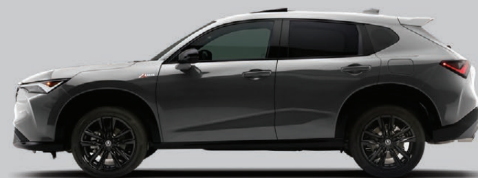
Exterior: Gris Cósmico Interior: Rojo