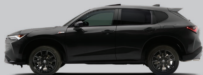
Exterior: Negro Cristal Interior: Negro / Rojo