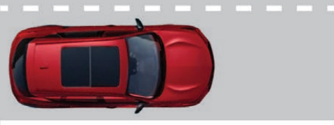
— SISTEMA DE MITIGACIÓN DE SALIDA DE CARRETERA (RDMS)