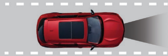
— SISTEMA DE CONSERVACIÓN DE CARRIL (LKAS) + ALERTA DE CAMBIO DE CARRIL (LDW)