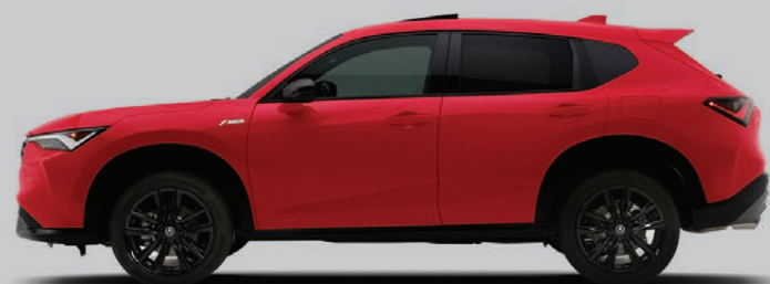
Exterior: Rojo Milano Interior: Negro

Los colores varían según el color y la versión elegida. Consulta disponibilidad con tu Distribuidor Acura.