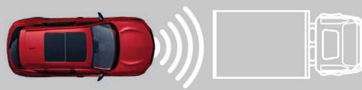
— SISTEMA DE ALERTA DE FRENADO POR COLISIÓN FRONTAL (FCW)