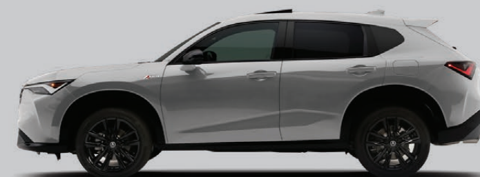
Exterior: Plata Solar Interior: Negro